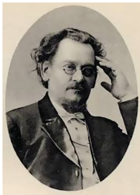
Иван Виссарионович Троицкий

После утверждения проекта Устава его основной автор приступил к организации Русского комитета Международной ассо-